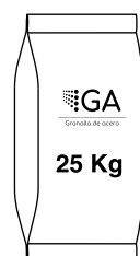
Bolsas plasticas de 25 kg