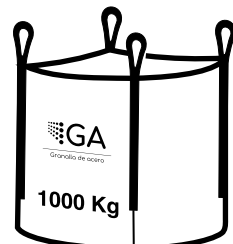
Big bags de 1000 Kg

Desde 1962 fabricando abrasivos de calidad superior